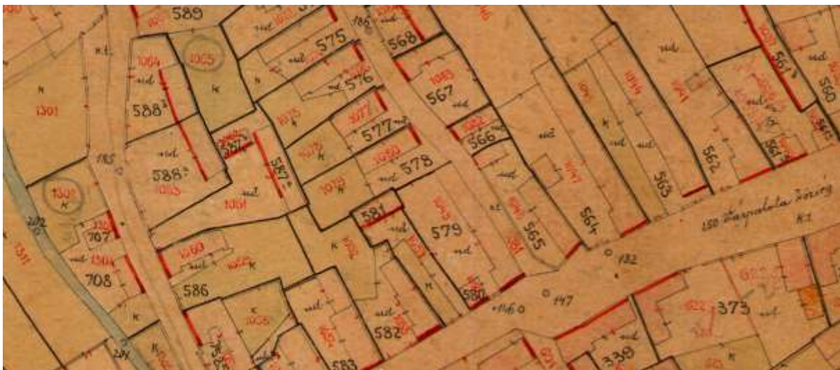
kivonat az 1925-ös kataszteri térképből