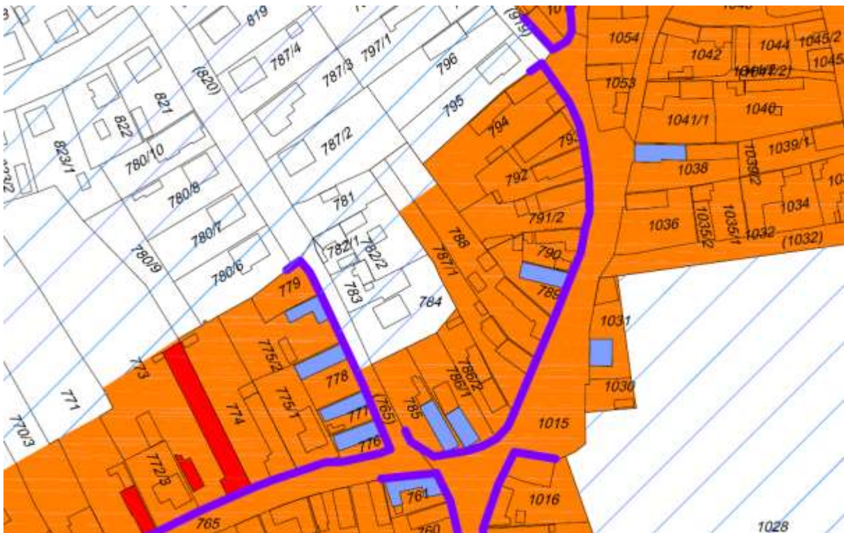
a TKR 1.2.1. mellékletének javasolt módosítása