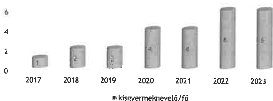
Diplomát szerzett kisgyermeknevelők számának növekedése 2017 és 2022 között

2023. február hónapban 2 kisgyermeknevelő jelentkezett felsőfokú BA képzésre, bízom benne, hogy folytatódik az ilyen irányú fejlődés is.